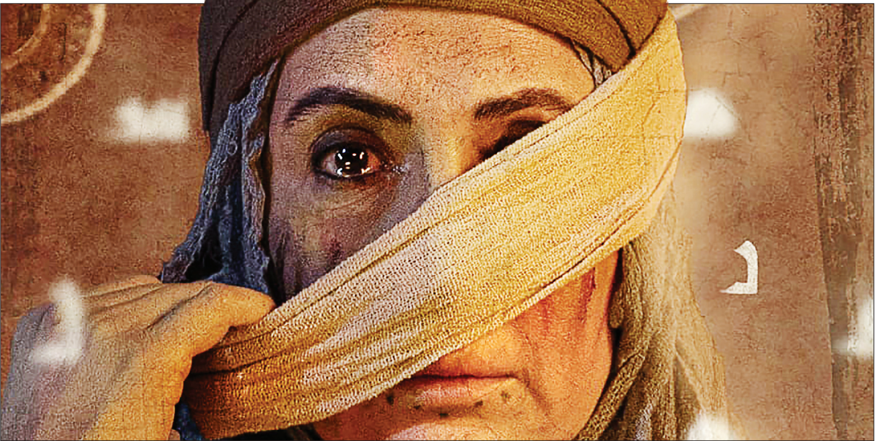
عکس میهنی شیرازه