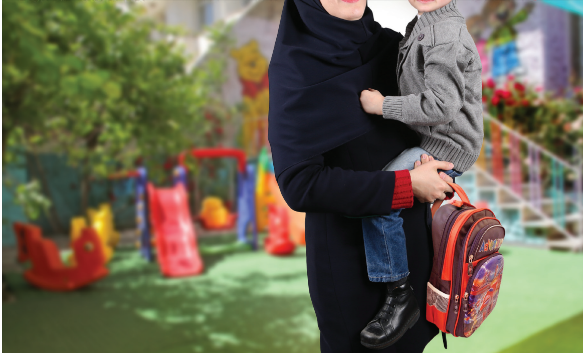
طرح: محمدعلی خلیلی

امروزه و با توجه به نوع زندگی شهری، فریز کردن نان یکی از راهکارهای رایج است پس بهتر است، نان قبل از مصرف گرم شود. نان سرد امکان چاق شدن فرد را افزایش می‌دهد؛ نان گرم هضم بهتری دارد ولی در هر حال افراد دچار اضافه وزن باید در مصرف این ماده غذایی دقت کنند.