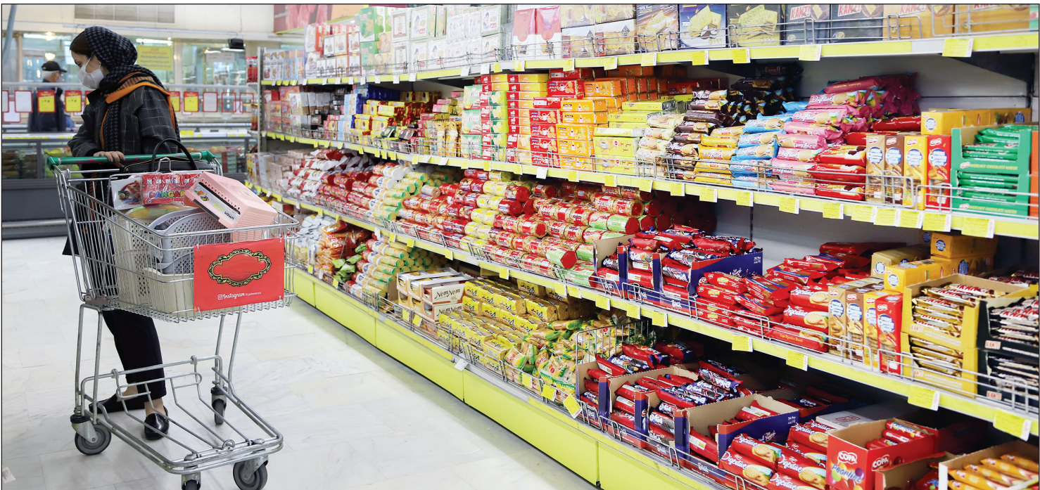
عکس همشهری‌نا سالان