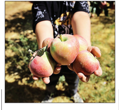
باغ‌های سیب شهرستان زن

هر سال از حدود ۷هزارهکتار باغ‌های سیب استان همدان بیش از ۱۵۰هزارتن سیب درختی برداشت می‌شود. شهرستان زن در ۸۰کیلومتری شمال همدان قرار دارد.