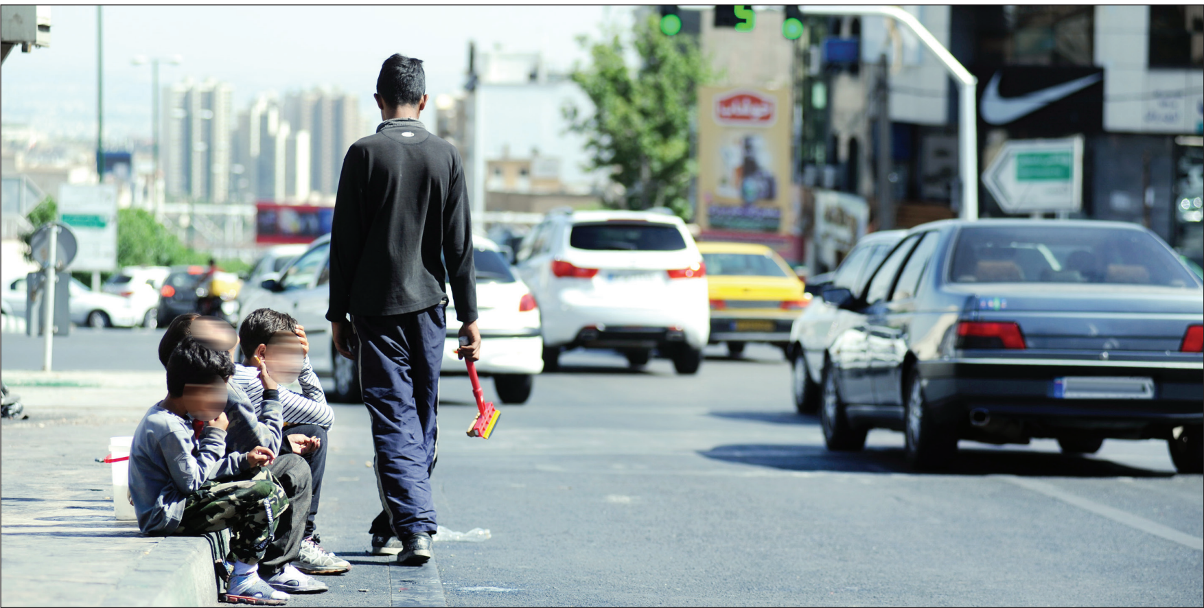
عکس: همنشینی امیر رئیسی