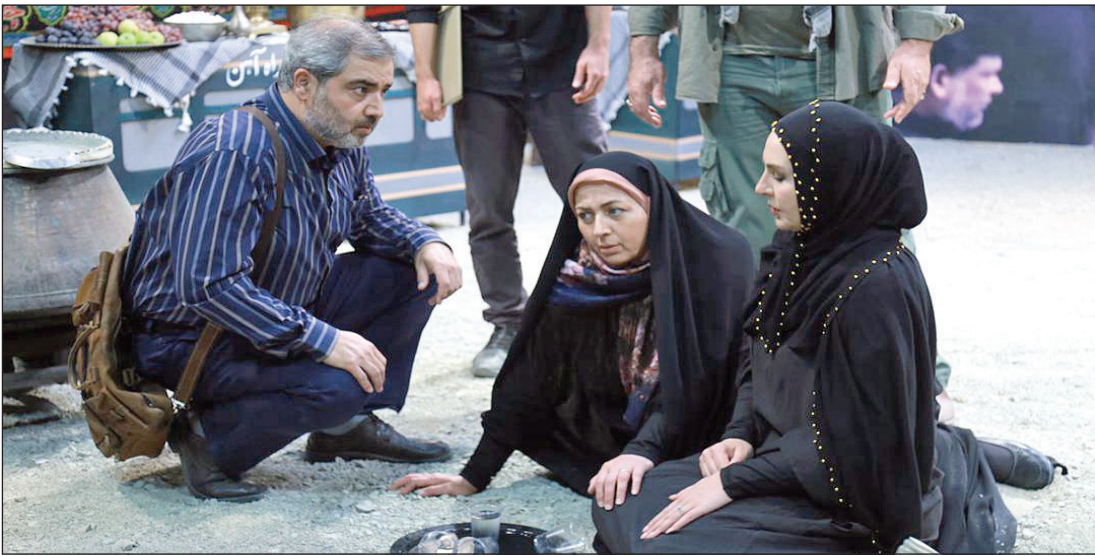
تصویری از برنامه مودها

شبکه‌های تلویزیونی اربعین حسینی را در قالب برنامه‌های زنده و ترکیبی پوشش می‌دهند