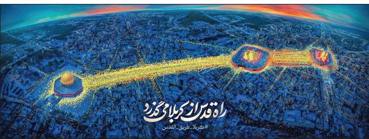
تصویری از برنامه به‌نام

تکیه در شبکه افق ویژه‌نامه «تکیه» هم از شبکه افق سیمما پخش می‌شود، این ویژه‌نامه که پیش از این در دهه اول برنامه از آنتن شبکه افق شده بود، با محوریت راهپیمایی و زیارت اربعین، حوالی ساعت ۲۴ به وقت ایران و ۲۲:۲۰ به وقت عراق بار دیگر به مدت ۱۰ شب با حضور مداحان و سخنرانان مختلف در کنار گنبد و بارگاه حرم سیدالشهدا (ع) مهمان خانه‌هاست. بررسی اهمیت راهپیمایی مردمی اربعین، جهاد تبیین، اخبار روز از مسیر کربلا و همچنین حال و هوای بین‌الحرمین و گفت‌وگو با سخنرانان، مداحان و کارشناسان مذهبی از جمله مسائلی است که در «تکیه» به آن پرداخته می‌شود.