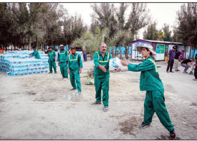
شبانه‌روزی مشغول خدمت‌رسانی به زائران هستند. وی با اشاره به تعداد نیروهای اعزامی به شهر نجف

خاطر نشان کرد: تعداد این نیروها نزدیک ۵۰۰ نفر است و از مناطق مختلف شهرداری تهران به شهر نجف اعزام شدند تا توفیق خدمت به زائران امیرالمؤمنین (ع) را داشته باشند.