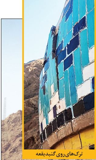
ترک‌های روی کنبه‌بقعه