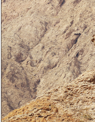
بقعه بی‌بی‌شهربانو