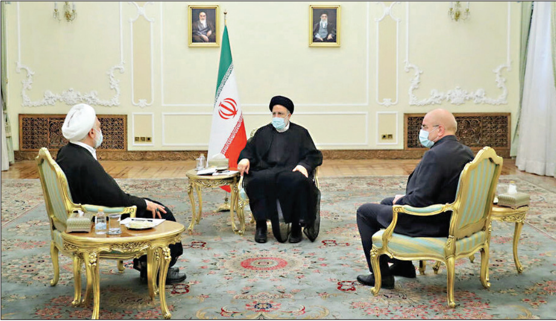
انجمنی از جلسه سران قوا با حضور رئیسی، آردی و قالیباف