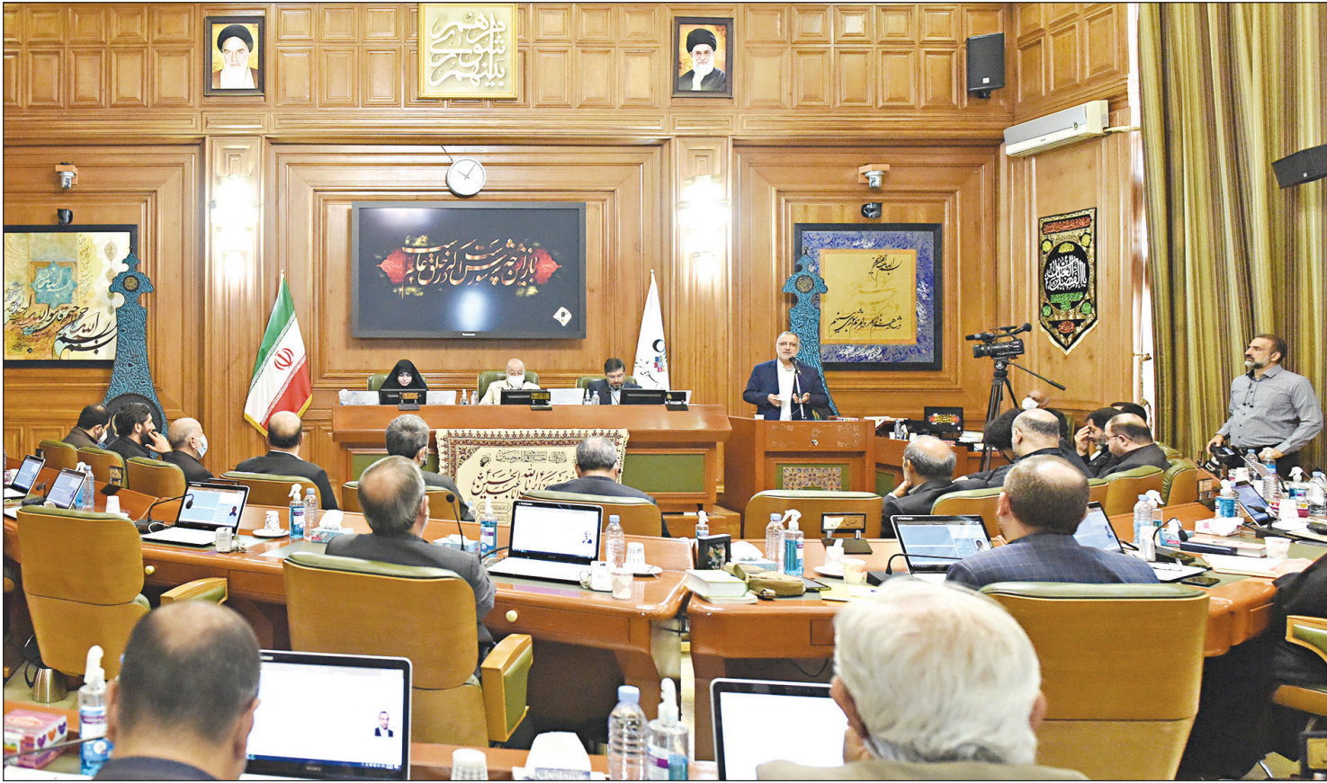
نگارخانه: جلسه شورای شهر