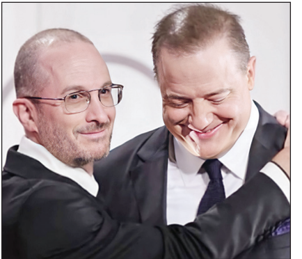
گلابه مدیر جشنواره ونیز

آخرین فیلم آرونوفسکی، «مادر» به سال ۲۰۱۷ بازی می‌گردد که تماشاکرانش را به ۱۲صت تقسیم کرد؛ عده‌ای آن را شاهکاری درباره روند خلق یک اثر هنری می‌دانستند و برخی دیگر معتقد بودند که این فیلم چیزی فراتر از یک تریلر روانشناختی معمولی نیست. با این حال نمی‌توان کتمان کرد که تقریباً همه فیلم‌های آرونوفسکی جذاب هستند و معمولاً تجربه‌ای نو در عالم فیلمسازی به شمار می‌روند. کاری که آرونوفسکی در «هننگ» با فریزر انجام داده بی‌سابقه نیست. او در فیلم «کشتی‌گیر» (۲۰۰۸) نیز میکی روریک را که سال‌ها بود از بازی در نقش‌های مهم فاصله گرفته بود، به‌عنوان نقش اصلی فیلمش برگزید و بار دیگر روریک را به مرکز توجهات آورد.