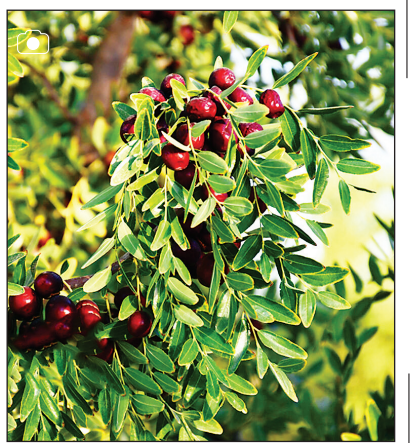
برداشت عتاب در خراسان جنوبی

عتاب میوه ای منحصر به فرد و از محصولات ویژه خراسان جنوبی است که به دلیل سازگاری با آب و هوای این منطقه تولید آن در سال های اخیر افزایش داشته و هم اکنون ۹۸ درصد عتاب کشور نیز در این استان کشت می شود.