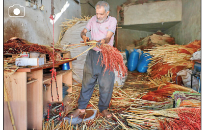
هنر سنتی چاروبافی