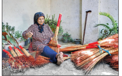
هنر سنتی چاروبافی

چارو یا سازه با شاخه «به گویش مازنی» از گیاهی بومی به نام آرزن ساخته می‌شود. در بعضی از مناطق استان مازندران، این گیاه کشت و برداشت و پس از خشک شدن به‌صورت دستی بافته می‌شود. بافندگان چارو یا دقت ساقه‌های گیاه آرزن را در کنار هم قرار می‌دهند و برای دسته‌چارو از سیم‌هایی پارک و ظرفیت استفاده می‌کنند، همچنین از نخ‌های پلاستیکی رنگارنگ در قسمت تاج، بهره می‌گیرند. به‌دلیل توسعه شاپرزارها و باغ‌های مرکبات، کشت گیاه آرزن در مازندران کاهش پیدا کرده است. کم‌کم با تولید چاروهای برقی و رواج پیدا کردن آنها، استفاده از چاروهای دستی کاهش یافت. تنها منطقه استان مازندران که خرید و فروش چاروهای دستی در آن رواج دارد، امیرکلاقی بابل است. منبع: مهر/ احوالات