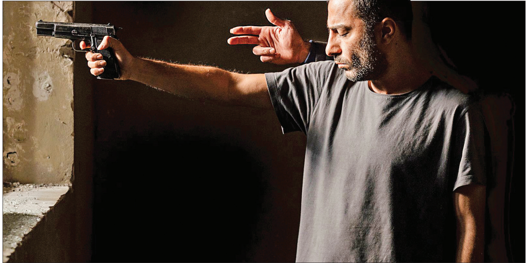
شاهی از فیلم سبب‌داخلی، مجید از فیلم‌های ایرانی حاضر در جشنواره ونیز