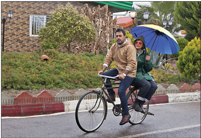
روزهای سیل؛ به کارگردانی آرش محمدرحیمی

برای فیلمی جدید با نام «کیسک محبوب من» به‌دنبال دریافت پروانه ساخت است. کاترم راست گفتار هم قصد دارد «اماد مقبول» را بسازد. آرش معیریان با سابقه ساخت فیلم‌هایی همچون «کما»، «چپ دست» و «زن‌ها فرشته‌اند ۲» نیز به‌دنبال ساخت فیلمی است با نام «دیوانه باش آدم