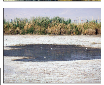
نقش‌های نیلوفر به شماره افتاد

سراب نیلوفر در حاشیه روستایی به همین نام در ۲۰ کیلومتری شمال غرب کرمانشاه قرار دارد که به دلیل کاهش بارش‌ها و خشک‌سالی در آستانه خشک شدن کامل قرار گرفته است. همچنین زندگی آبزیان و پرندگان که در این تالاب زندگی و از آن تغذیه می‌کنند در بی‌خشک شدن سراب نیلوفر در معرض خطر قرار گرفته است. برداشت‌های غیرمجاز آب و عدم رعایت الگوی کشت یکی دیگر از عواملی است که سبب تشدید کم‌آبی و خشک شدن سراب نیلوفر کرمانشاه شده است.