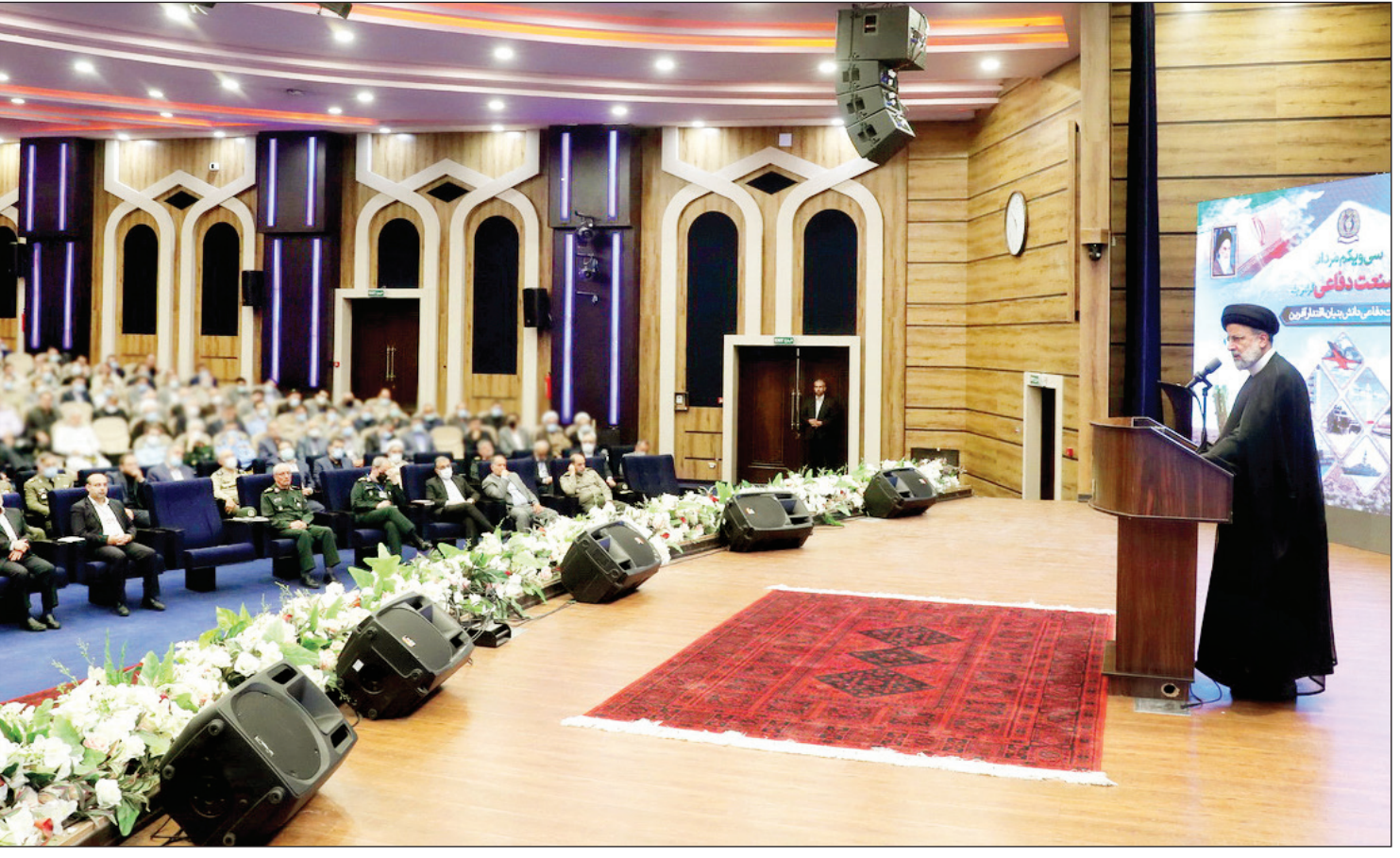
رئیس‌ی در دیدار مدیران و کارکنان وزارت دفاع مطرح کرد