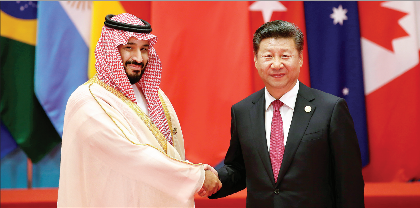
سفر بین‌المللی به چین در سال ۲۰۱۳ برای شرکت در نشست گروه ۲۰ کشور آسیای شرقی