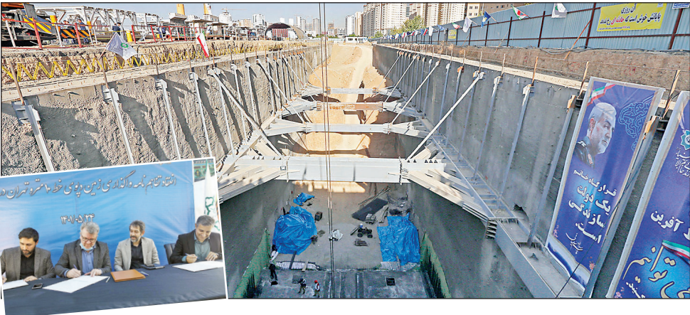
طراحی پایانه آغاز و انجام می‌شود.

به گزارش همشهری، حمایت‌های اداره کل امور بانوان شهرداری تهران از طرح‌های ریحان شهر شامل ۳ محور است؛ در محور اول طرح‌ها به مناطق و محله‌ها معرفی می‌شوند و افراد فعال در هر محله شناسایی خواهند شد. در محور دوم نیز از ظرفیت‌های در اختیار شهرداری مانند بوستان‌ها بانوان و سراسرای محله‌ها برای برگزاری دوره‌های آموزشی و توان‌افزایی شهروندان استفاده می‌شود.