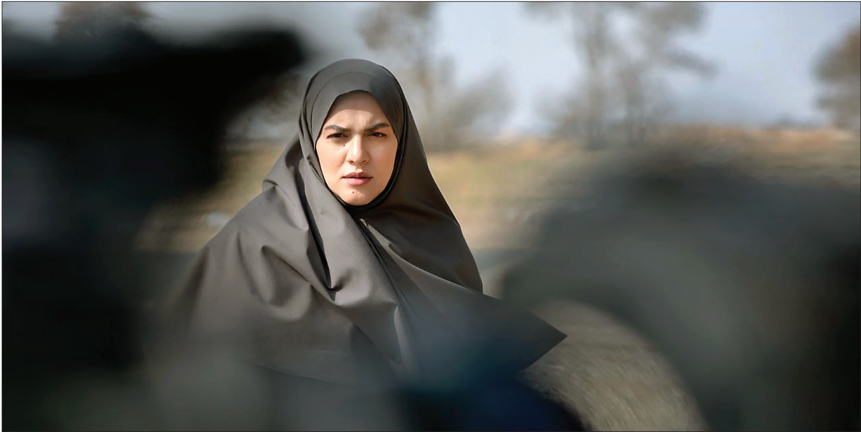
نمایشته ایرانی در نمایش از سربال بر روی صدا بی صدا، تیرماه ۱۳۹۷

«برف بی صدا می بارد» پر بیننده‌ترین سربال تلویزیون در نیمه دوم تیرماه شد