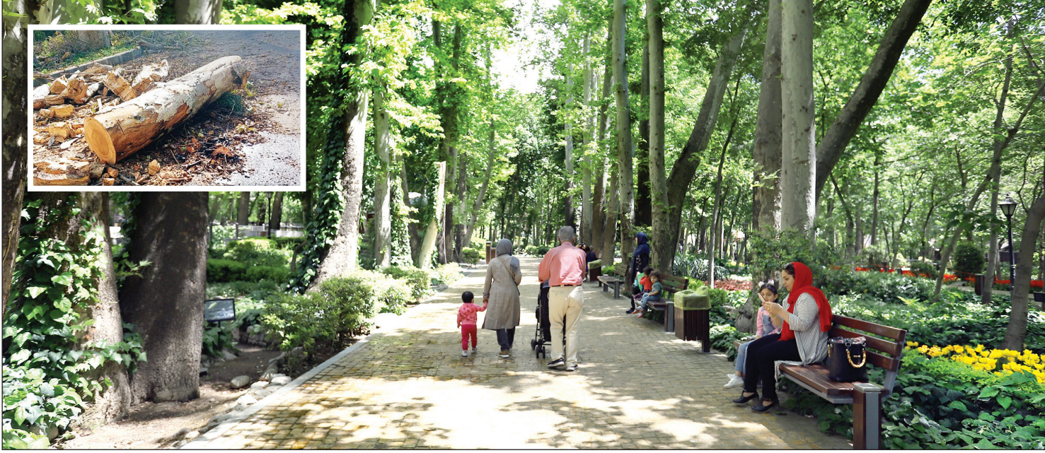
درختان تک قدیمی‌ترین درخت‌های تهران هستند.