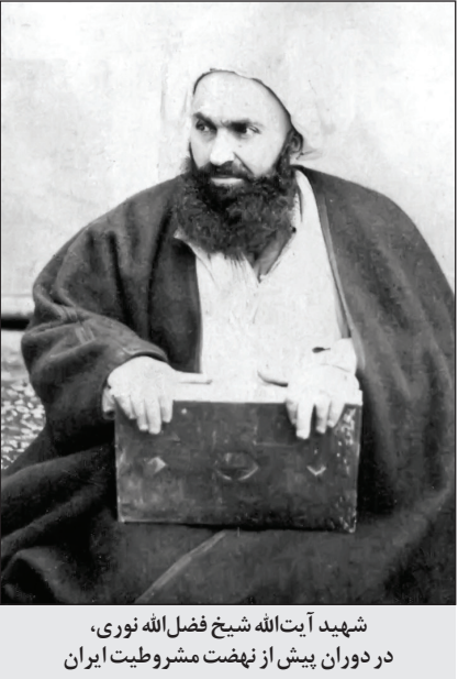
شهید آیت‌الله شیخ فضل‌الله نوری، در دوران پیش از نهضت مشروطیت ایران

لحاظ مصالحی گفتنی نیست، اما فهمیدی هست...».