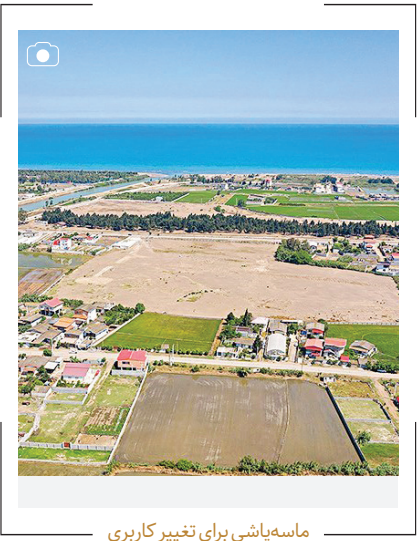
ماسه‌باشی برای تغییر کاربری

در حالی که مازندران یکی از سبزترین و حاصلخیزترین استان‌های کشور محسوب می‌شود، متأسفانه عده‌ای سودجو با بهانه‌های مختلف برای گرفتن تغییر کاربری و ایجاد ساخت‌وساز غیرمجاز، دست به اقدامات عجیب و غیرقابل باور می‌زنند. در روستای ساحلی «کنهه کلامحله میرو» که در نزدیکی شهرستان پابلسر است، هکتارها زمین کشاورزی با ماسه‌پاشی و سنگ‌ریزی، به زمین‌های بایر تبدیل شده و در حال تفتیک و ویلاسازی است.