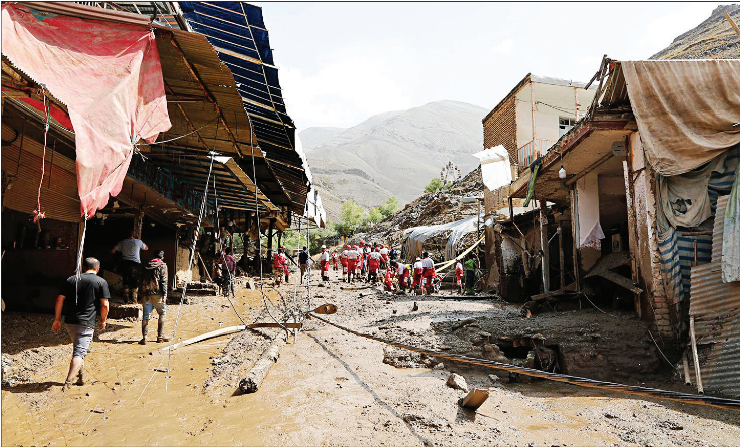
عکس از سیل در تهران از فرام‌طالبه

وی با اشاره به اینکه بیش از ۱۰۰ روستای این استان با یک‌هزار نفر خانوار از این طرح بهره‌مند شده‌اند، اضافه کرد: فاز اول این پروژه با وجود تمام موانع و مشکلات به‌علت شرایط جغرافیایی استان به اتمام رسید و برنامه‌ریزی برای اجرای فازهای بعدی این پروژه در دستور کار است. مدیر کل ارتباطات و فناوری اطلاعات آذربایجان غربی افزود: شبکه ملی اطلاعات در ۳۰ درصد زیرساخت، خدمات و محتوا پیش‌بینی شده است که لایه اول آن در حوزه تامین زیرساخت‌های لازم برای این شبکه از تعهدهای وزارت ارتباطات به‌شمار می‌رود.