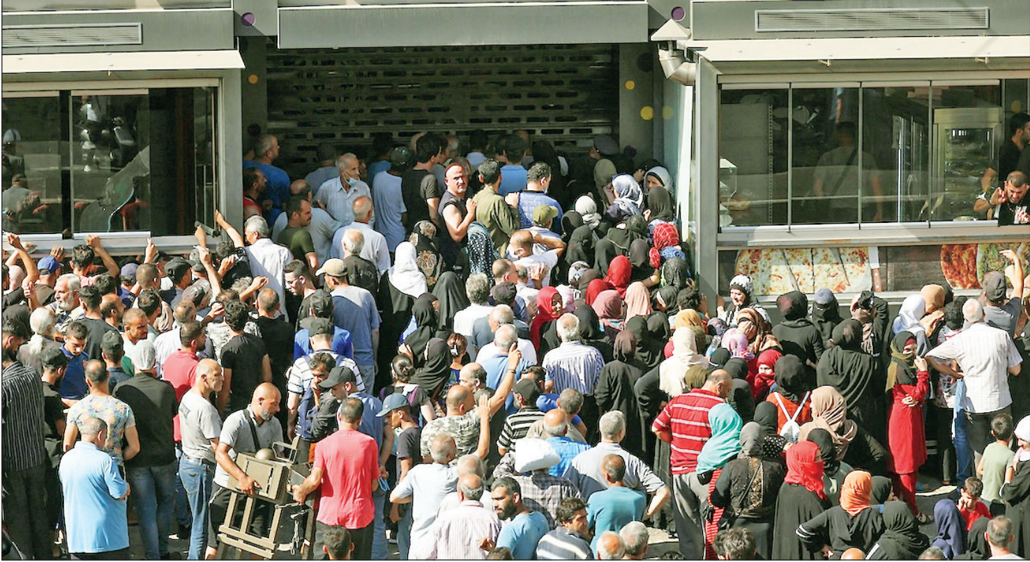
عزیز مردم به یک ثانوی در بیروت برای خرید نان عکس روزگار