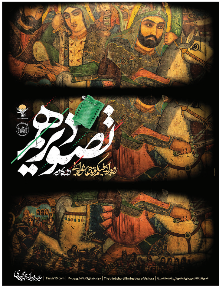
دوره نهمین جشنواره بین المللی فیلم کوتاه آسیا | The third short film festival of Ashura | این جشنواره ۳۳ شهریور ۱۳۹۷ | Tashvi 10.com

سال هاست که بر سر تعریف و تعیین حد و حدود فیلم دینی میان مسئولان و نظریه پردازان سینمای ایران بحث می شود. هنوز هم تعریف مشخص و واحدی از سینمای دینی - که همگی روی آن اجماع داشته باشند - به دست نیامده است. به اعتقاد عددهای فیلم دینی فیلمی است که به طور مستقیم موضوع یا رویدادی دینی را به تصویر بکشد و به عبارتی، تکنیک های باینی سینما را در جهت مفهوم، ایده یا واقعه ای دینی و مذهبی به کار بگیرد. از سوی دیگر، گروهی دیگر بر این اعتقادند که سینمای دینی الزاما نباید به طور مستقیم به موضوعات دینی بپردازد، بلکه هر آنچه در چارچوب اخلاقی و معارف والای انسانی قرار بگیرد، می تواند به عنوان فیلم دینی ارزیابی شود.