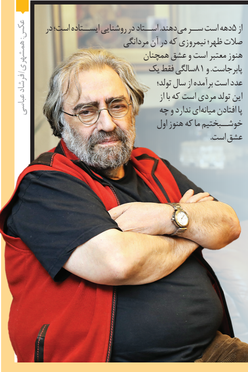
عکس: همشهری/ اثر: دانیال معمار

«تو، جای به آدم، راه می‌افتادی که به مسلمانو وادار کنی، برگرده، برای یه پهبودی شهادت بده...؟ برا یه چهود؟! -آه من طرف حقم چیزی به من حکم نمی‌کنه برا اینکه پهبودی هستی طرف نباشم! آدم باش، پهبودی باش! آدم باش، مسلمان باش! آدم باش، هرچی می‌خوای باش...!» چهارده یازده ساله‌ایم که در سوره که در گرمای تابستان در خنکی سایه ساختمانی بلندنشسته‌ایم و دیالوگ مرور می‌کنیم و بعد از معروف‌ها و تکیه‌کلام‌های مشهور، نوبت به تک جمله‌هایی می‌رسد که باید خیلی کمیایی باز باشی که یادت نباید که کجای کدام فیلم بوده و «که» به مادرش بگه می‌شنن ایکنی دهنه» را ممد الکی کجای «رضاموتوری» می‌گوید، در نوجوانی من بیشتر از تمام بچه‌محل‌ها کمیایی باز هستم. با تمام خامی و نادانستگی مخصوص این سال‌ها و البته همراه با خلوص و عشقی که هنوز بزرگ‌تر نشده‌ام که به آن لک بیفتد. زمان گذشت و از نوجوانی به بهار جوانی رسیدیم و آن عشق غریزی، همراه با آگاهی و شناخت شد و بی‌اعتنا به کنایه‌های مغرضانه راه خودمان را رفتیم. پای چیزی که درست بود ایستادیم. تسلیم نسیم‌ایم زود گذر نشدیم. برایمان مهم نبود که فحاشی به کمیایی یکی از الزامات ورود به عالم روشنفکری است؛ که اگر روشنفکری این است گویر پدرش... حالا ماییم و آقای کمیایی؛ عزیز عزیزانم که هنوز و همیشه هر اثرش شوری می‌افتند و اعلام حضوری است جوانانه و پر از حس و عاطفه و شناخت؛ که در ۱۱ سالگی‌اش همچنان خلق می‌کند و همچنان کافی قرارش با ما ایستاده است و به ستنز می‌اندیشد. بی‌پروای هر موج و جریان روزی و بی‌توجه به دشمنانه‌هایی که ستایشگران تاریکی، بیش