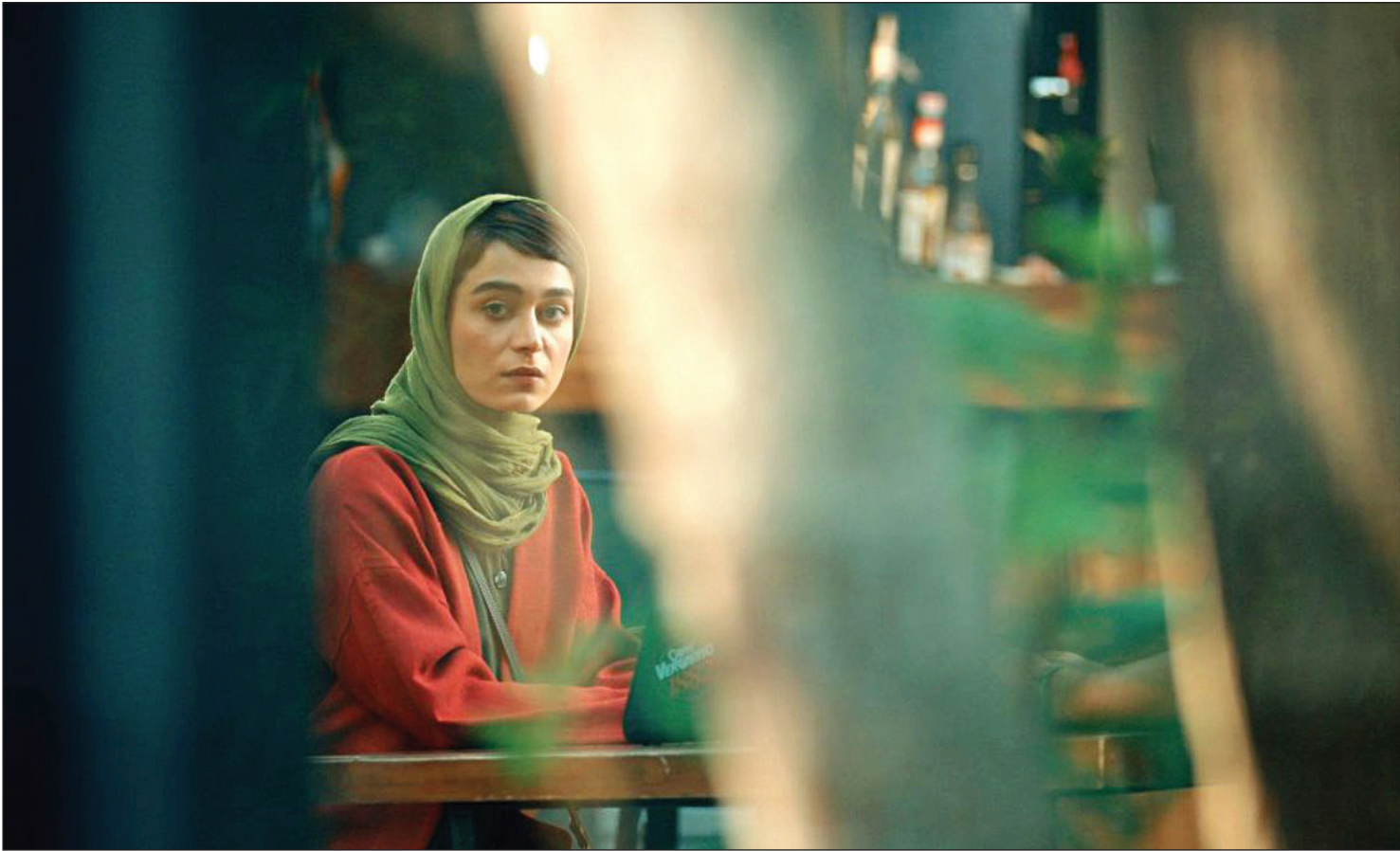
نمایی از فیلم تار آنگس، سینما محمدی

گزارش همشهری از اکران فیلم های مخاطب خاص