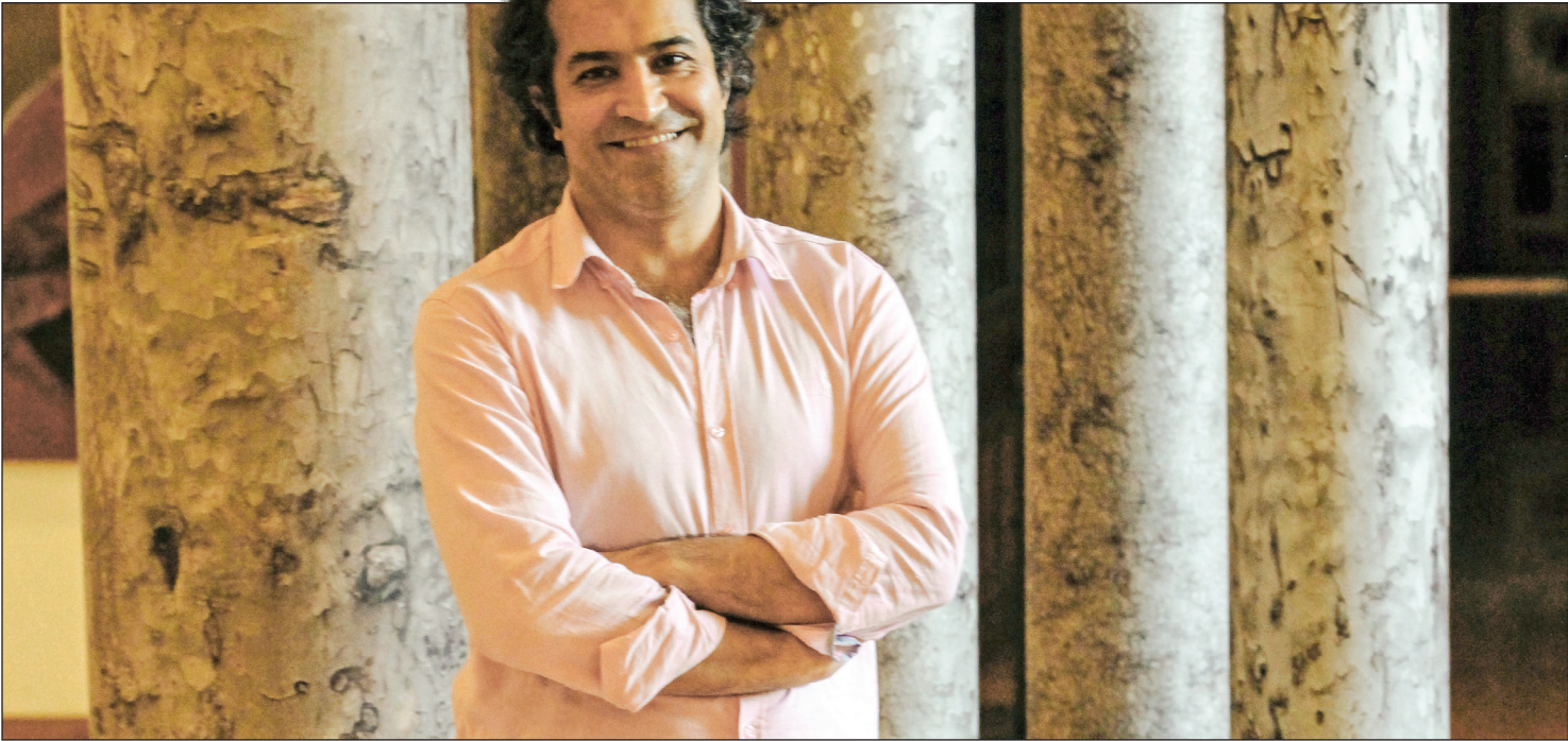
عکس‌نمایی از فیلمساز