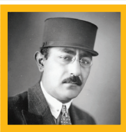
همسر شهید شریفی‌راد