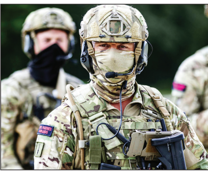
گزارش مرتب با جنایات جنگی نیروهای ویژه ارتش انگلیس در افغانستان، «جرمی کوربین»، رهبر پیشین حزب کارگر خواستار پاسخگویی ارتش به این گزارش شده است. کوربین در توییت خود نوشته است: با نیروهای ویژه ما باید مانند همه رفتار شود. گزارش کوربین پس از پخش برنامه پانوما برای بی‌سی‌سی‌وی می‌گیرد که در آن شواهدی تک‌اند دهنده از ارتکاب جنایات جنگی به‌دست نیروی هوایی ویژه انگلیس در مدت زمان مأموریت در افغانستان ارائه می‌شود. در این گزارش همچنین گفته شده که تلاش‌هایی برای پنهان کردن ابعاد این جنایت صورت گرفته است.

افرادى که در این واحد خدمت کرده‌اند، گفته‌اند شاهد کشته‌شدن افراد غیرنظامی غیر مسلح به‌دست نیروهای انگلیسی در عملیات شبانه بوده‌اند و برخی نظامیان بین خودشان بر سر اینکه چه کسی می‌تواند بیشتر آدم بکشد، رقابت می‌کرده‌اند. واحد نظامی اس.ای.اس (SAS) که در این گزارش به‌عنوان واحد نظامی متهم شده، همچنین در گزارش حضور در افغانستان تلاش کرده تا رکورد تعداد کشتار افراد را بشکند. براساس این گزارش، نظامیان انگلیسی افراد غیرنظامی در افغانستان را به رب‌گاری می‌بستند و سپس برای توجیه اقدام خود مدعی می‌شدند که این افراد سلاح‌جاسازی کرده بودند. این شیوه توجیه قتل غیرنظامیان در بیشتر گزارش‌های ارتش انگلیس دیده می‌شود، اما گزارش‌شکری