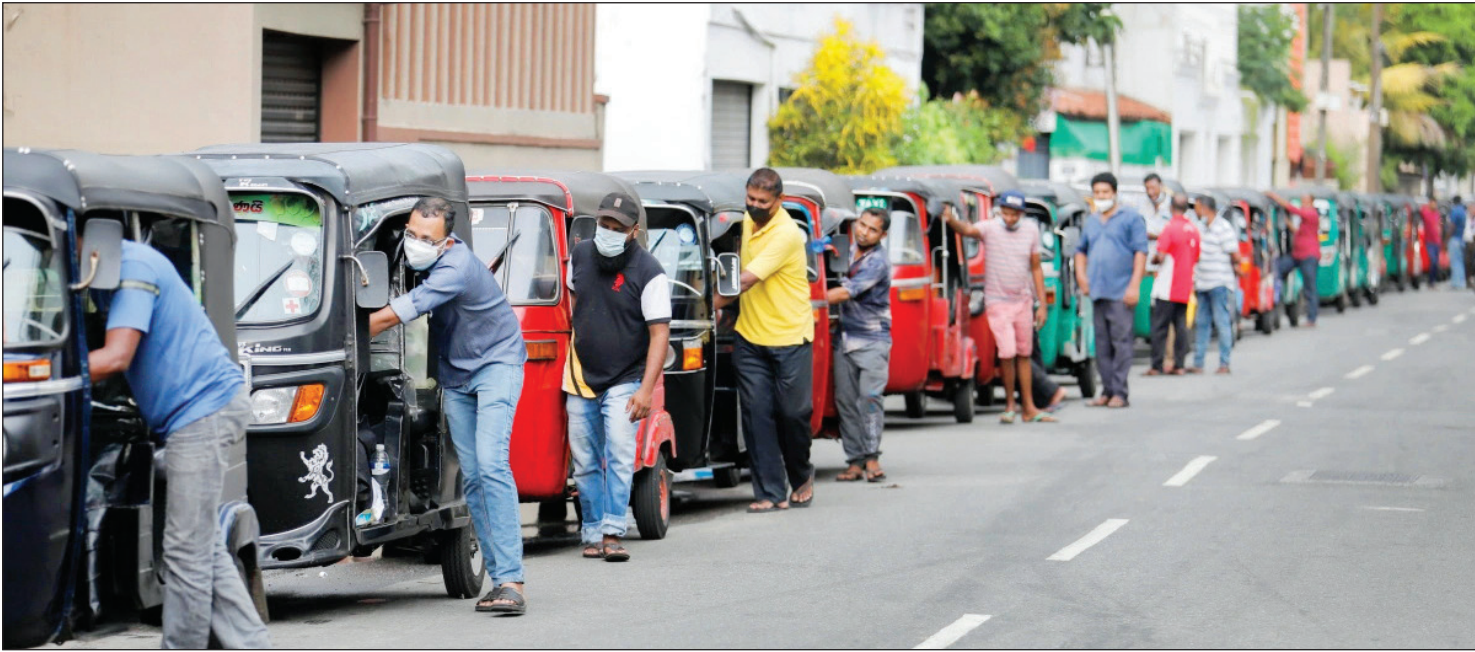
صفه‌های طولانی در مقابل بمب‌شهرین‌های عالی سریلانکا