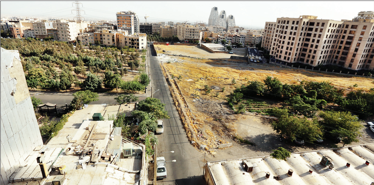
فضای زمین گلدریس در باغ فیض