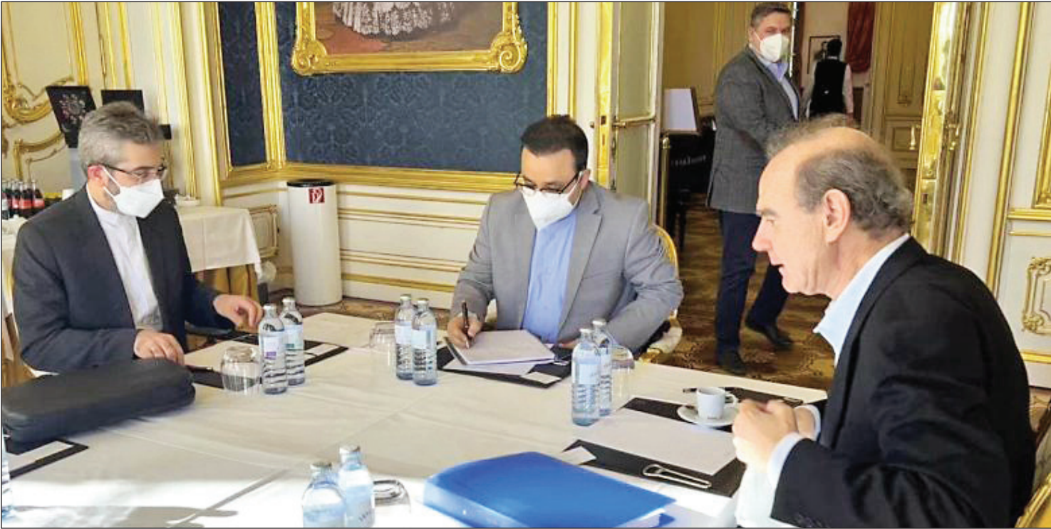
نشست بهمن‌ماه ۱۴۰۰ باقاری و جوزا در وین

پاسخ امیر عبداللهیان به بازی منزوی ساختن ایران در مذاکرات: