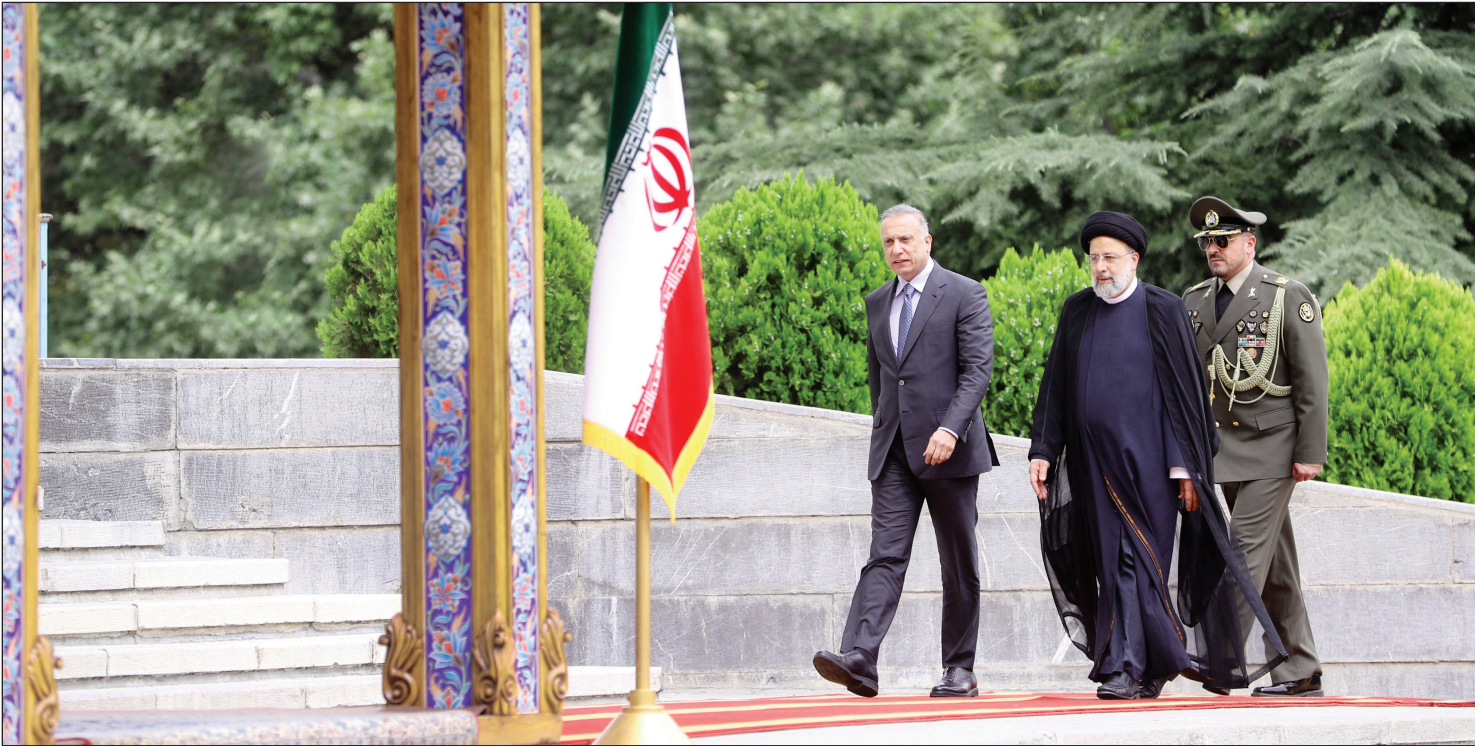
عکس سفر نخست‌وزیر عراق به تهران به نخستین روزهای تیرماه