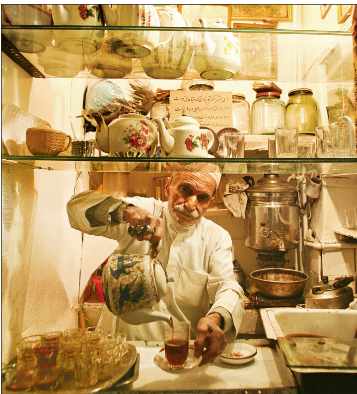
چای نوشی در روم

چای نوشی در کوچک ترین قهوه خانه جهان یک بهانه است تا حال خوبان را با هم قسمت کنیم