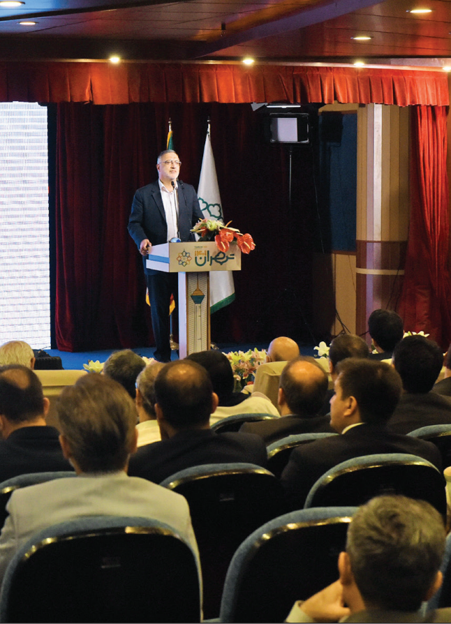
علیرضا زاکانی

زاکانی: تهران جدید را با حفظ مزایای موجود دنبال می‌کنیم