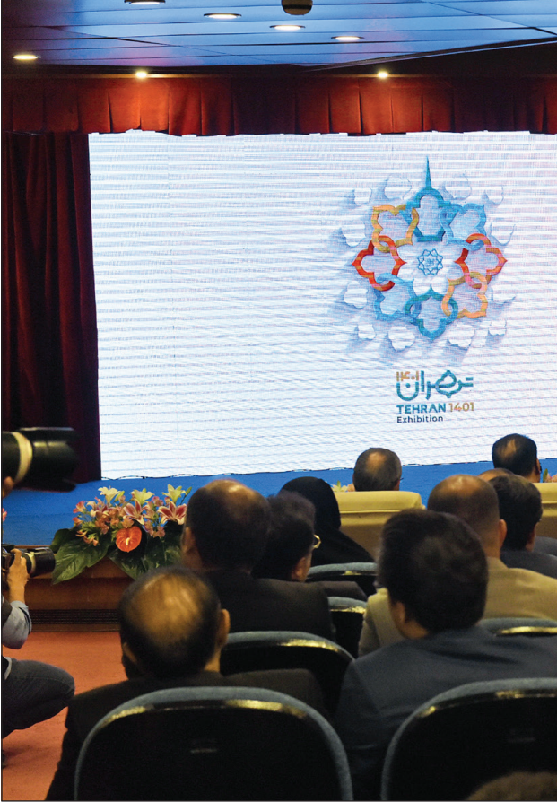
علیرضا زاکانی

شهردار تهران همچنین گفت: «ما وجه داخلی خود را بر مبنای تکیه بر مردم آغاز کرده‌ایم، ما در منزلگاه سوم به نخچیان مردم رسیده‌ایم. آنچه برای ما قدرت ایجاد می‌کند علم است؛ لذا با وجود تمام تحریم‌های ظالمانه، براساس بیانات مقام معظم رهبری مسیر ما حرکت بر محور نخچیان و رشد علمی بوده است. نخچیان ما نماد و نمودی در شرکتهای دانش‌بنیان دارند و گوشه‌ای از توانمندی‌های خود را در این نمایشگاه به نمایش گذاشته‌اند. زاکانی با بیان اینکه باید به سستی برویم که تمام توانمندی‌ها را بسنجیم کنیم تا با تکیه بر مردم با محوریت نخچیان ظرفیت خود را عیان کنیم، گفت: «تهران ظرفیت بسیار بالایی دارد که در بخش تاریخی، علمی، دانشی، فرهنگی و سایر بخش‌ها از جمله اقتصاد قابل توجه است؛ بنابراین در مدیریت شهری تلاش ما این است که در یک‌اقت و چشم‌انداز مشخص و در طول یک‌هفته بتوانیم راه تحول و پیشرفت در حوزه کالبدی شهر را طوری ترسیم کنیم که تهران آینده، واجد شرایط و صلاحیت‌های موجود و دارای ویژگی‌های دیگری باشد که هم‌اکنون از کمبود آنها رنج می‌بریم.» شهردار پایتخت تأکید کرد: «حمل و مقدمه آن، این است که توانمندی‌ها و ظرفیت‌های مدیریت