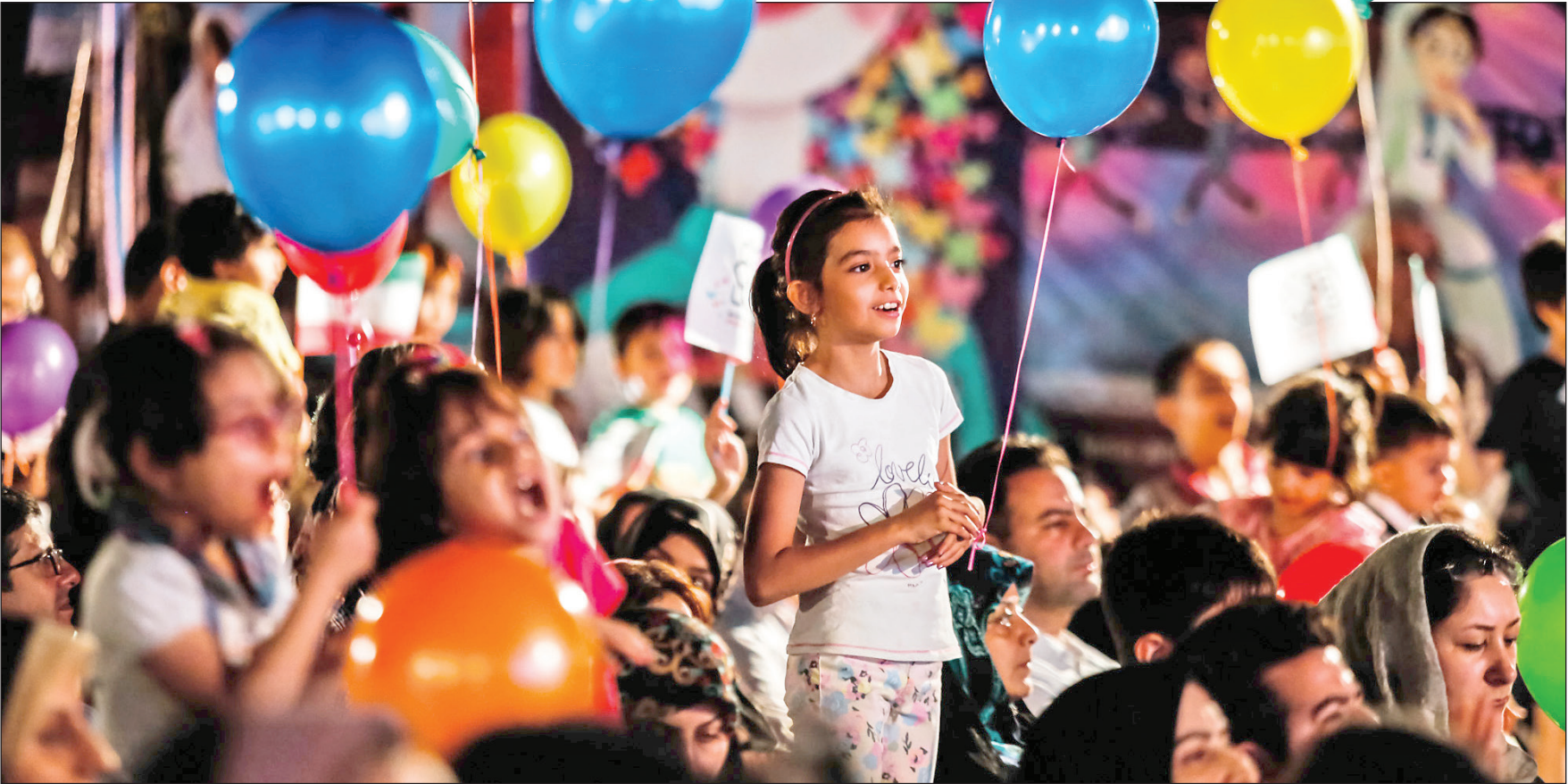
عکس همشهری از جشنواره جهانی

مدیرعامل فآرایی می‌گوید که جز اصفهان، ۴ استان دیگر متقاضی برگزاری جشنواره فیلم کودکان و نوجوانان شده‌اند