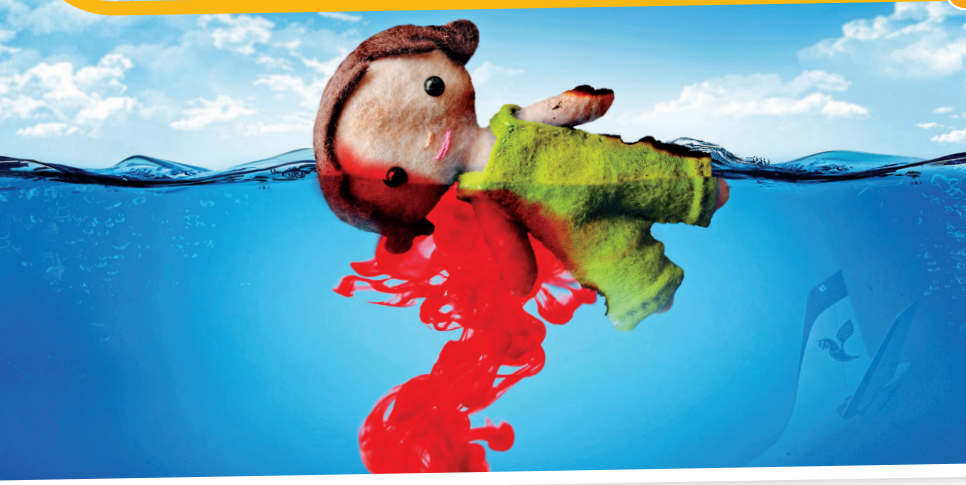
فرماندهی دریایی ایران