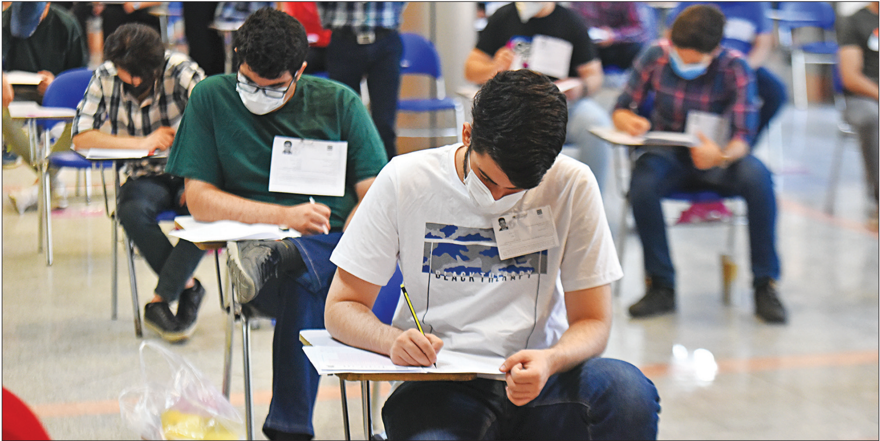
عکس هنرمندی علیرضا طهماسبی