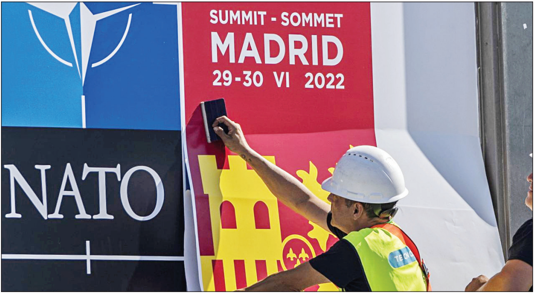
مادرید میزبان نشست سران ناتو است.

با چرخش تمرکز ناتو به سمت چین، گام به گام خطوط جنگ سردی جدید میان شرق و غرب در حال ترسیم شدن است