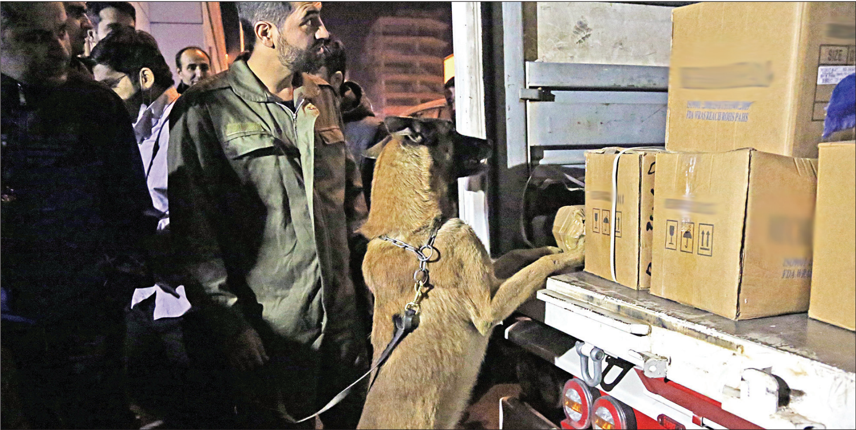
عکس همیشگی از حسن موسوی

یکشنبه ۵ تیر ۱۴۰۱ • ۲۶ ذی‌القعدة ۱۴۴۳ • سال سی‌ام • شماره ۸۵۲۹