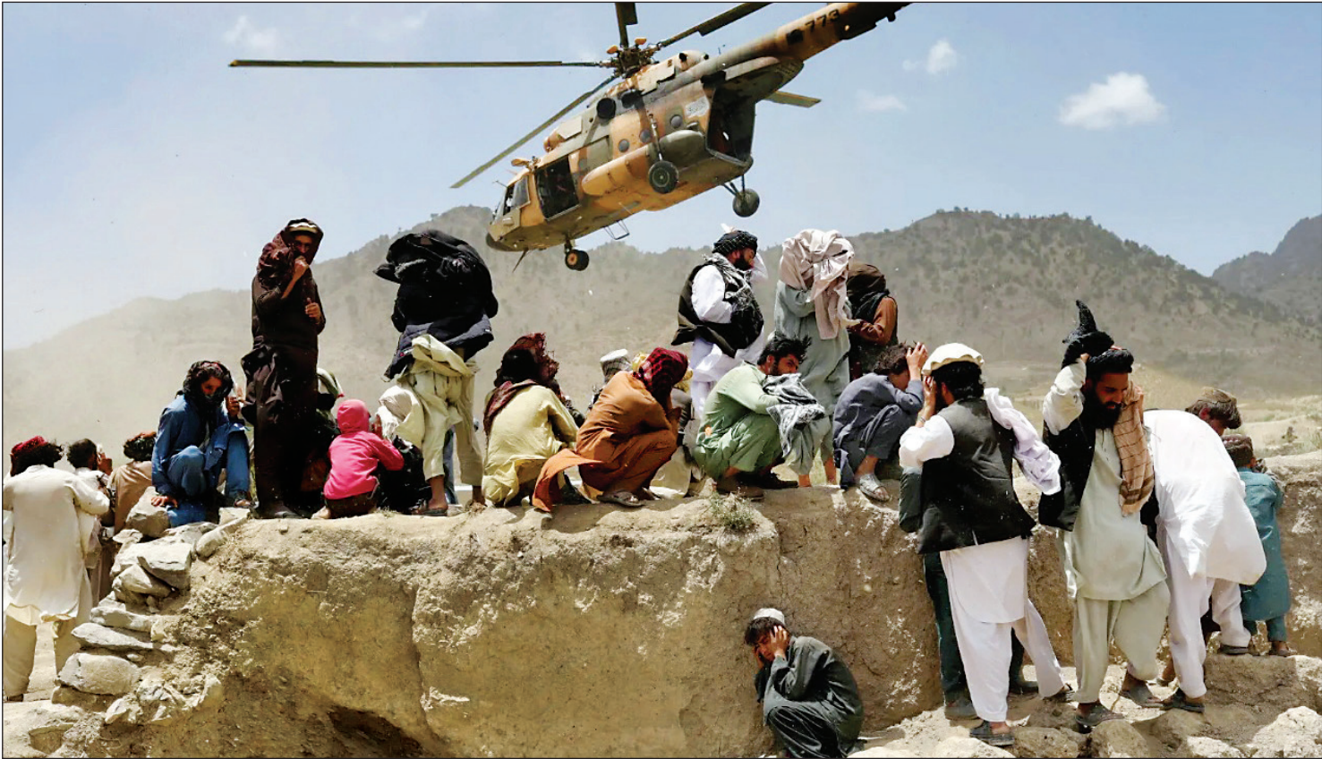
ارسال کمک برای زلزله‌زدهان شهر غلج، روز پنجشنبه در خارا