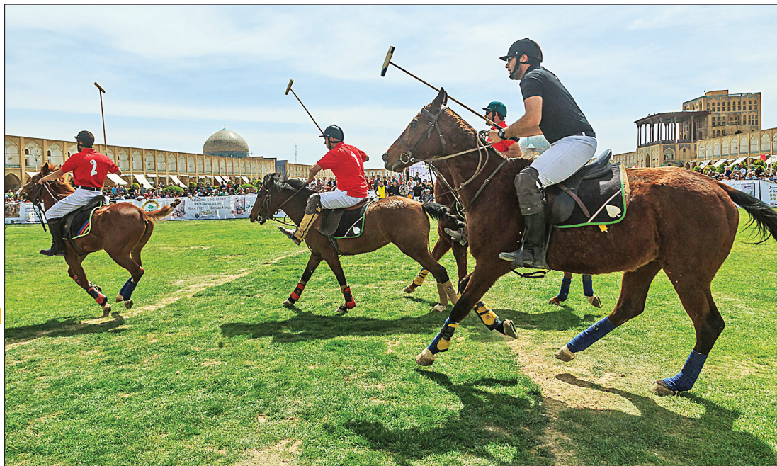
عکس همشهری از جدید مسکن

با وجود قدمت تاریخی برخی استان‌ها، فدراسیون چوگان به دلیل ثبت میدان نقش جهان، اصفهان را پایتخت این ورزش ملی می‌داند