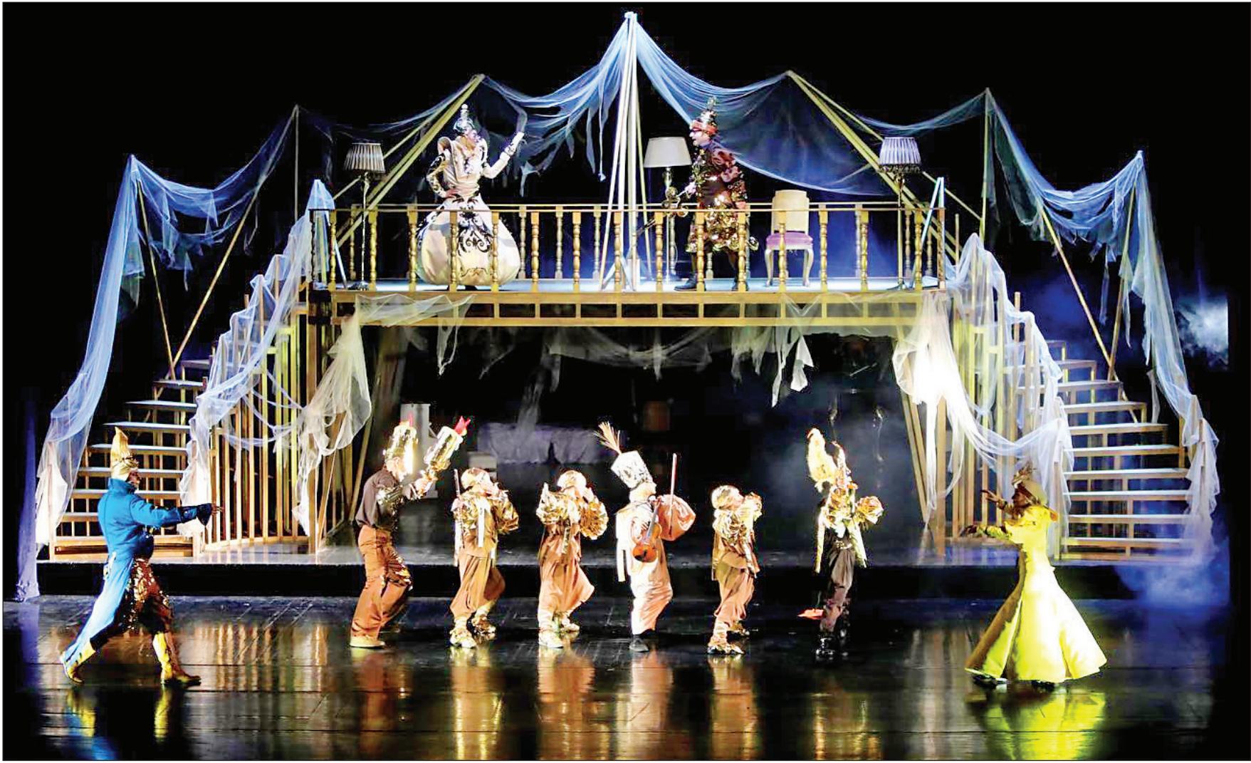
نمایش دوم در نمایش‌های اخیر باخک

گروه‌های نمایشی، بیش از ۱۰۰ نمایش را در تابستان روی صحنه می‌برند