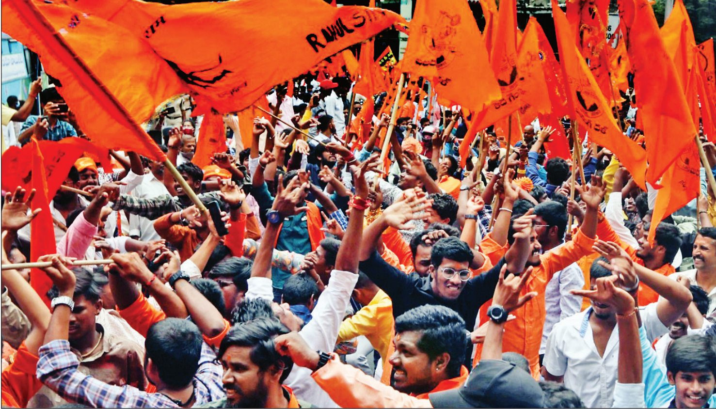
هندوها در یک مراسم مذهبی در حیدرآباد، آندرا پرادش، آ. پی. ا. پی.

نام این ناو جدید از نام استان فوجیان در سواحل جنوب شرقی این کشور گرفته شده است. ناو دیگر ارتش خلق چین نیز بر اساس همین سنت به نام استان‌های لیائونینگ و شاندونگ نامیده شده‌اند. با پهلو گرفتن این ناو، چینی‌ها داخل آن بین ۲ تا ۶ ماه زمان خواهد برد. همچنین حداقل ۶ ماه نیز برای آزمون‌های پروازی با سیستم موسوم به منجنیق لازم است. گفته می‌شود که نخستین هواپیما احتمالاً در اواخر سال ۲۰۲۳ یا اوایل ۲۰۲۴ از این ناو به پرواز درخواهد آمد و احتمالاً عملیاتی شدن صد در صدی این ناو در سال ۲۰۲۵ اعلام خواهد شد.