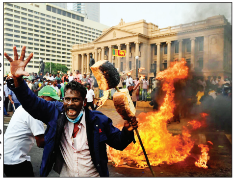
اعتراضات در کابل

عملیاتی این سازمان به ۷۰ میلیون دلار، مجبور شد جیره چندین کشور را نصف کند. بیلسی با اشاره به افزایش هزینه حمل‌ونقل، کود و سوخت در کنار همه‌گیری کرونا، بحران جنگ اوکراین و تغییرات اقلیمی به‌عنوان عوامل کلیدی ایجاد بحران کمبود غذا، اعلام کرد طی ۵ سال گذشته جمعیت افرادی که به گرسنگی مزمن مبتلا هستند، از ۶۵۰ میلیون نفر به ۸۱۰ میلیون نفر افزایش یافته است. او همچنین می‌گوید که در دورانی مشابهی آمار افرادی که شوک گرسنگی را تجربه کرده‌اند از ۸۱۰ میلیون نفر به ۳۲۵ میلیون نفر رسیده است. این افراد گروهی هستند که در سطحی بحرانی از ناامنی غذایی زندگی می‌کنند. به گفته رئیس برنامه جهانی غذای سازمان ملل متحد، پس از رکود اقتصادی سال‌های ۲۰۰۷ تا ۲۰۰۹، افزایش قیمت کالا و تورم منجر به آغاز شورش و ناآرامی در ۴۸ کشور جهان شد. امروز اما فاکتورهای اقتصادی جهان بسیار وخیم‌تر از ۱۵ سال پیش است و در صورتی که چاره‌ای برای مهار این بحران اندیشیده نشود، قحطی، بی‌ثباتی و مهاجرت‌های گسترده در جهان رخ خواهد داد؛ همانطور که تاکنون در سریلانکا، تونس، پاکستان و برور رخ داده است.