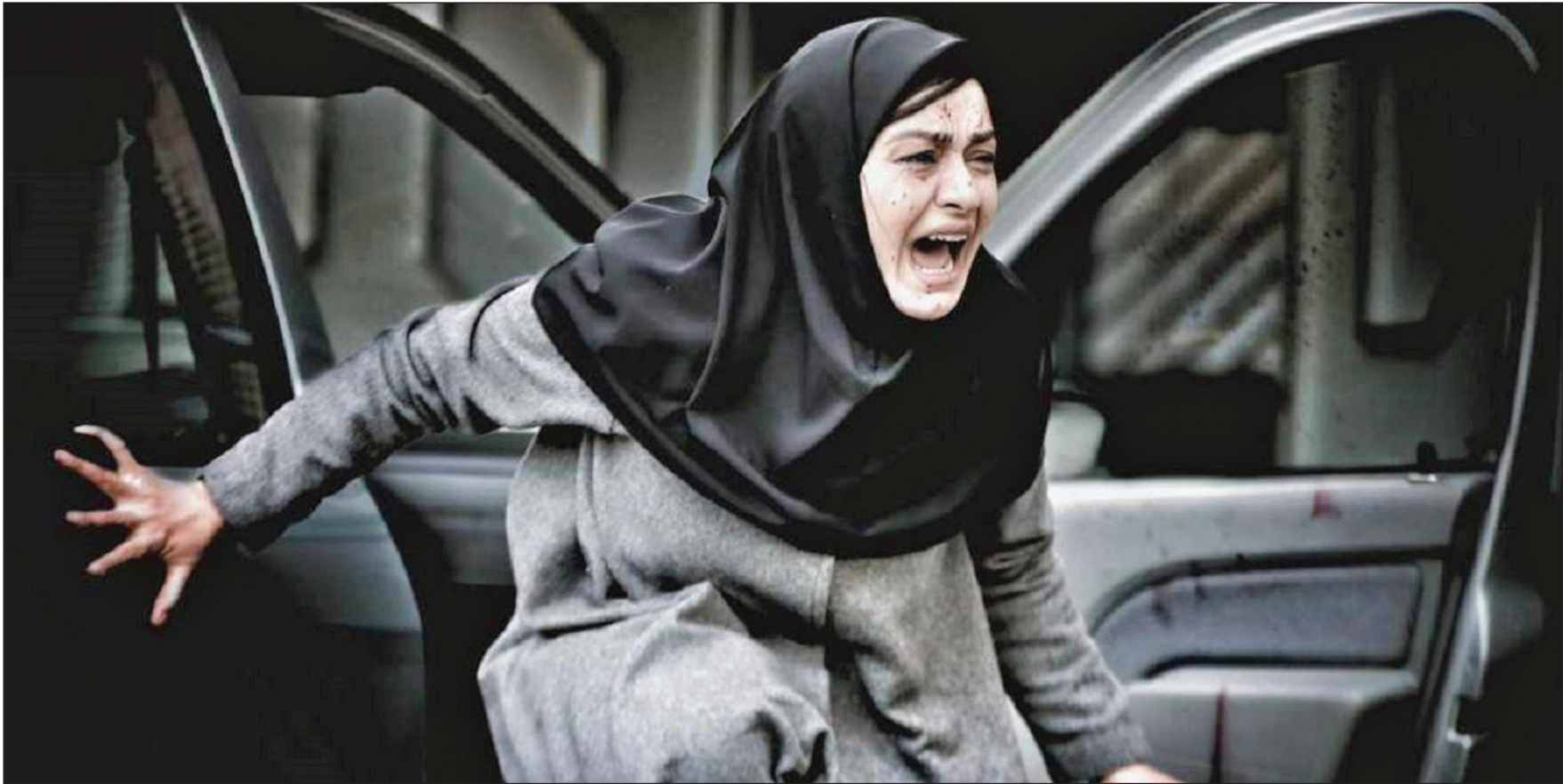
میرالازاری در نمایش فیلم‌هناس عجمید شرقی

حوزه هنری طرح فروش بلیت با قیمت شناور را کلید زد