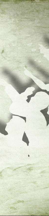
طرح شهسواری/محمدعلی حلیمبی