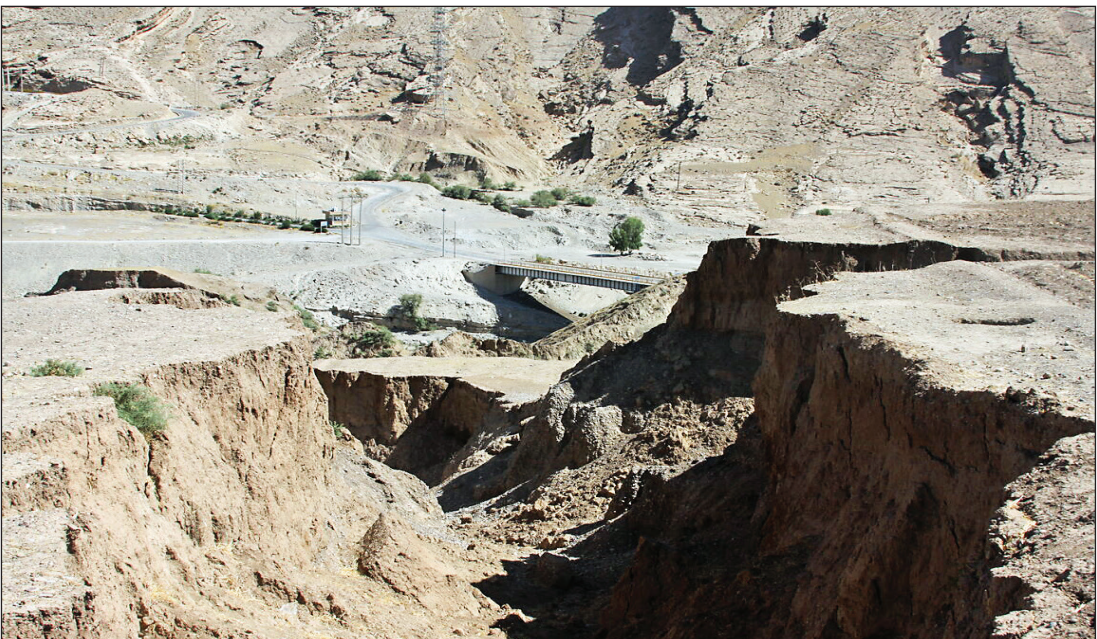
خبر ایجاد شده با این رانش زمین در روستای تلخاب

در فاز اول جابه‌جایی روستای تلخاب ۴۷ خانه در پایین دست سد سیمه استان ایلام به دلیل رانش زمین جابه‌جا خواهد شد