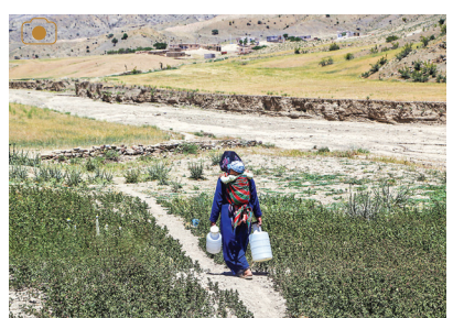
زندگی اهالی شیرین سو شیرین نیست

معاون تربیت و سلامت اداره کل آموزش و پرورش استان اصفهان گفت: آموزش و پرورش استان اصفهان ۱۶ هزار معلم کمبود دارد و این وضعیت بحرانی است. به گزارش تسنیم، آذرکیوان امیری‌پور گفت: طبق توافقات انجام شده با دانشگاه فرهنگیان به‌زودی حدود یک‌هزار دانش‌جو معلم به کمک آموزش و پرورش می‌آیند، اما این تعداد افراد جابجایی کمبودها نیستند.