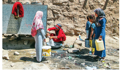
مردم روستای شیرین‌سو از توابع شهرستان مانه و سملقان در خراسان شمالی با محرومیتی عمیق مواجهند، محرومیت از آب آشامیدنی و مشکلات بهداشتی از این موارد است.