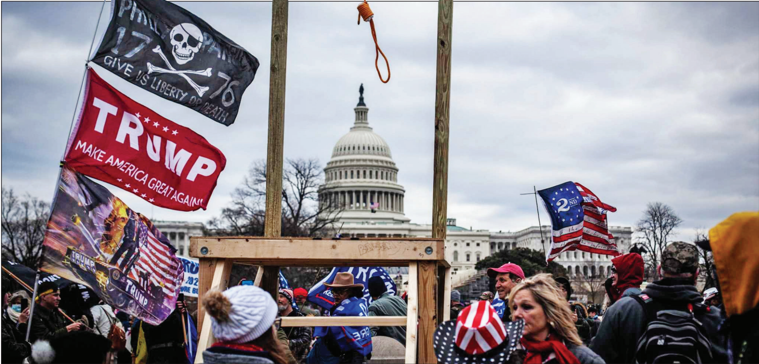
حمله هواداران ترامپ به کنگره در سال ۲۰۲۱