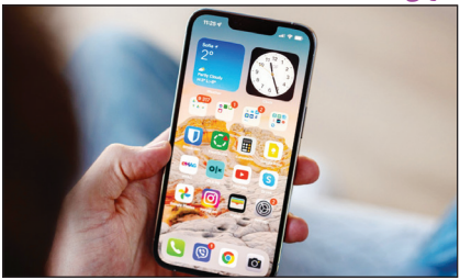
معرفی iOS 16

یکی از مهم‌ترین قسمت‌های این برنامه، معرفی جدیدترین سیستم‌عامل اپل برای آی‌فون‌های آیفونش بود. این شرکت در جریان برگزاری رویداد WWDC، در کنار معرفی سیستم‌عامل iOS 16 فهرست دستگاه‌هایی که از این سیستم‌عامل پشتیبانی می‌کنند را نیز منتشر کرد.